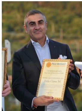
Della Ciana S.r.l.