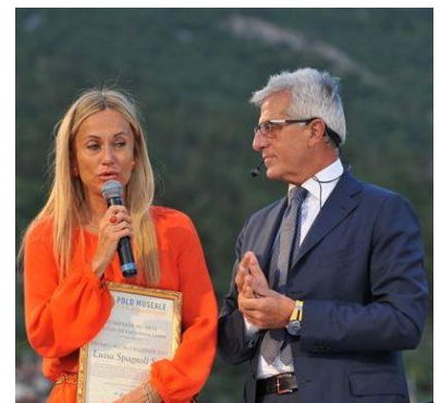
Luisa Spagnoli S.p.a.